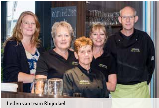
Leden van team Rhijndael

In elke WIJde zorglocatie wordt het restaurant gerund door een team Eten & Drinken. In deze WIJ een nadere kennismaking met het team van locatie Rhijndael.