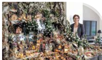
Yvones kerstdorp: net een sprookje!