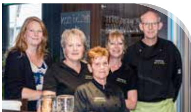
Leden van team Rhijndael