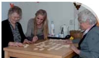
Wijdezorg investeert in jong zorgtalent