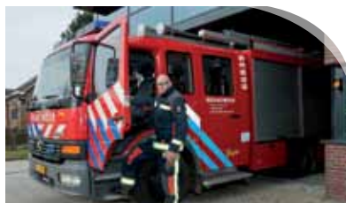
Zorgen voor veiligheid, dat zit in me