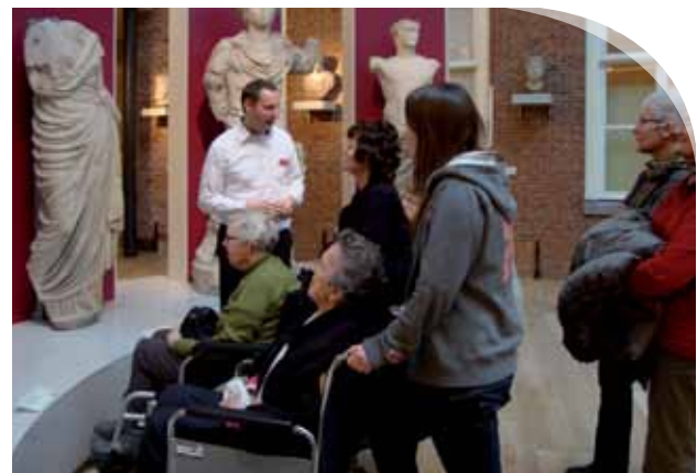
Het gezelschap kwam onder meer in een oude tempel.