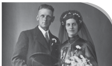
Bruidsjurk in de oorlog