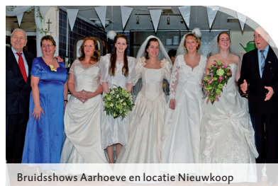
Bruidsshows Aarhoeve en locatie Nieuwkoop