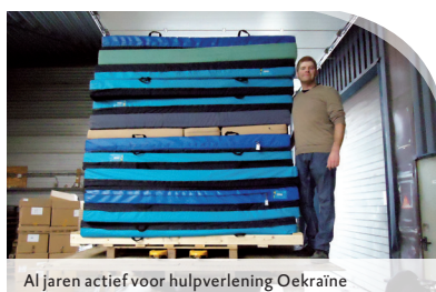
Al jaren actief voor hulpverlening Oekraïne