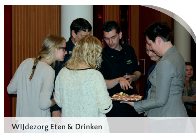
WIJdezorg Eten & Drinken