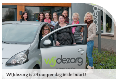
WIJdezorg is 24 uur per dag in de buurt!