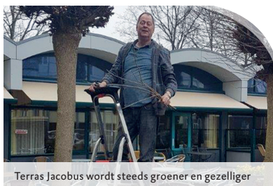
Terras Jacobus wordt steeds groener en gezelliger