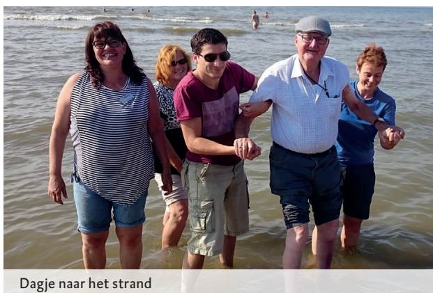
Dagje naar het strand

regio. “Ik was altijd buiten, ook na het werk, want dan was ik graag bezig in mijn groentetuin. Aan knutselen kwam ik helemaal niet toe. Na mijn pensionering veranderde dat. Ik heb toen heel wat vogelhuisjes en windmolentjes getimmerd.”