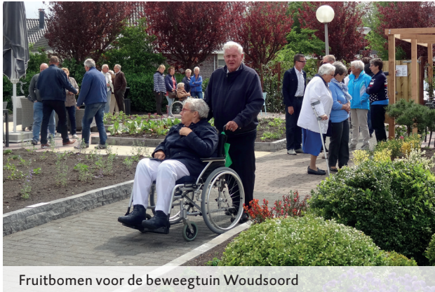
Fruitbomen voor de beweegtuin Woudsoord

Kwaliteitsverbetering zinvolle dagbesteding en deskundigheidsbevordering in volle gang!