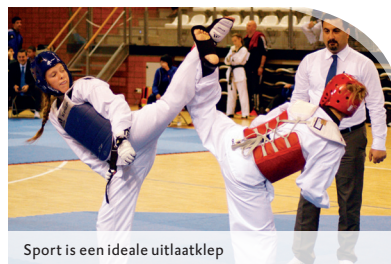
Sport is een ideale uitlaatklep