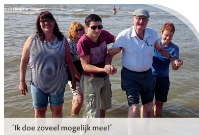
'Ik doe zoveel mogelijk mee!'