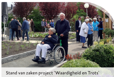
Stand van zaken project 'Waardigheid en Trots'