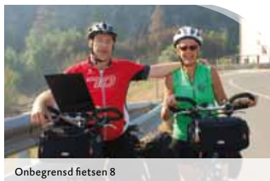
Onbegrensd fietsen 8