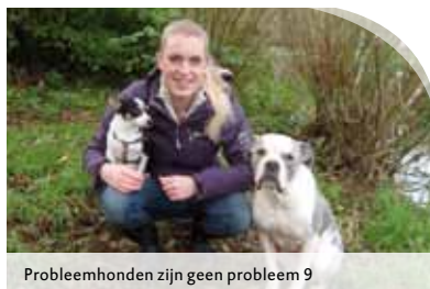
Problemhonden zijn geen probleem 9