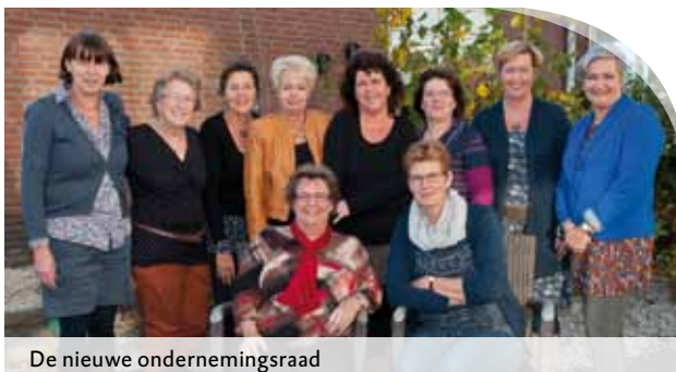
De nieuwe ondernemingsraad

Heb je belangstelling voor het OR-werk? Loop dan eens een poosje met ons mee en kijk hoe het je bevalt!