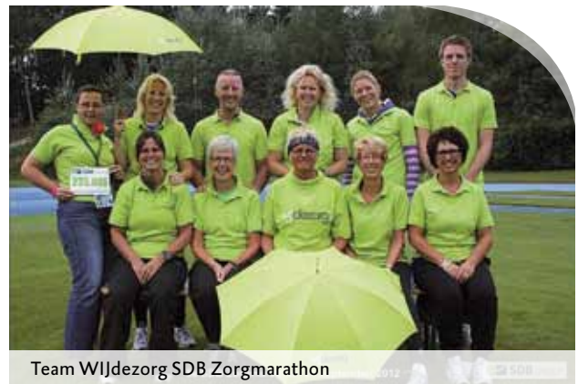
Team WIJdeZorg SDB Zorgmarathon

Afgelopen september nam een hardloopteam van tien WIJdeZorg-medewerkers deel aan de SDB Zorgmarathon in Papendal. In totaal deden 250 teams van zorginstellingen aan deze jaarlijkse hardloopestafette mee. Dit jaar was de opbrengst bestemd voor het Fonds Gehandicaptensport. Samen liepen de teams ruim € 34.000 bij elkaar.