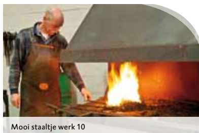
Mooi staaltje werk 10