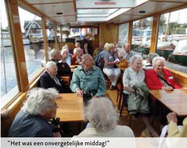
“Het was een onvergetelijke middag!”

Vaarmiddagen op de Nieuwkoopse Plassen groot succes!