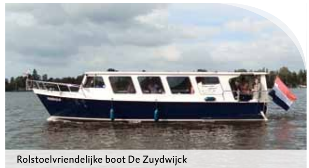
Rolstoelvriendelijke boot De Zuydwijck

Behalve het natuurschoon genoten de bewoners ook van elkaars gezelschap. “We kennen elkaar allemaal en hebben het tijdens zo'n uitje heel gezellig”, aldus mevrouw Van Lith-de Geus. “Aan boord werden we goed verwend. Eerst was er koffie met gebak en later kregen we ook nog een lekker borreltje. Het was een onvergetelijke middag!”