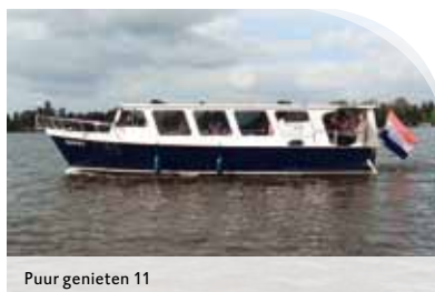
Puur genieten 11