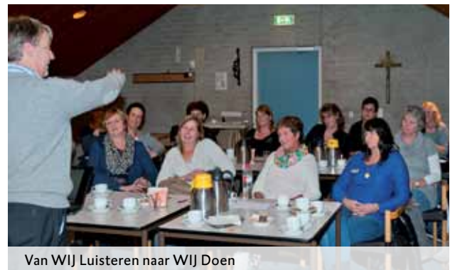
Van WIJ Luisteren naar WIJ Doen