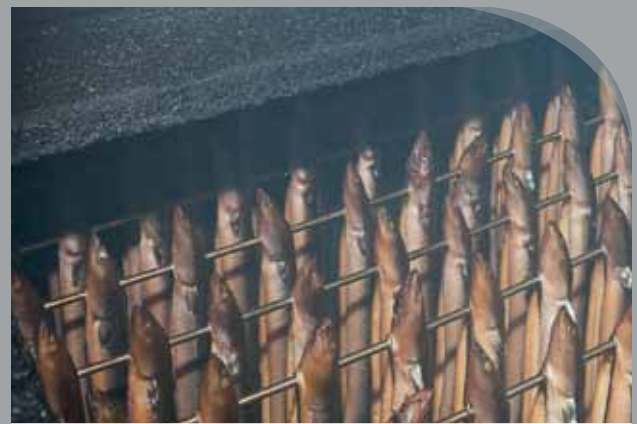
Elke vrijdag rookt Leo paling, doorgaans zo’n 200 exemplaren.

Leo’s gerookte paling smaakt als de beste en trekt klanten tot uit Alphen, Leiden en Den Haag!