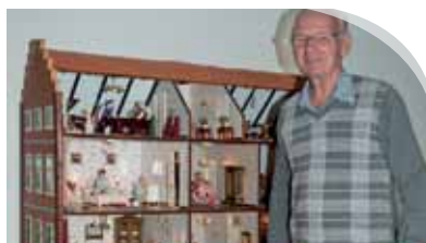
Iedereen geniet van het prachtige poppenhuis.