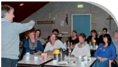
Van WIJ Luisteren naar WIJ Doen