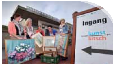
Tussen Kunst en Kitsch