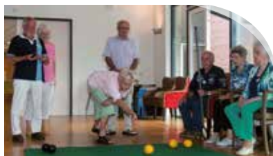
Project Beste Buur