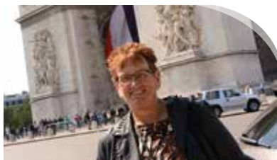
Genieten van een weekendje Parijs