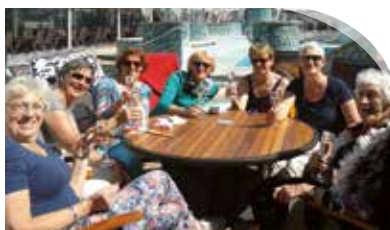
Een onvergetelijke cruisevakantie!