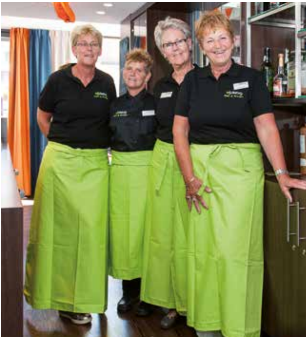
Nieuwe bedrijfskleding van Eten & Drinken

Op 3 juli organiseerde locatie Rhijndael een zomermarkt. Bewoners verkochten zelfgemaakte spulletjes en een aantal lokale ondernemers had een eigen kraampje. WIJde zorg Eten & Drinken presenteerde haar mogelijkheden op het gebied van catering. Veel bezoekers reageerden verrast: “Maken jullie dat allemaal zelf?”