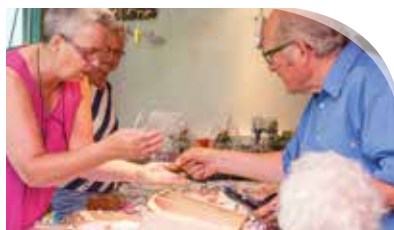
Zomermarkt Rhijndael drukbezocht