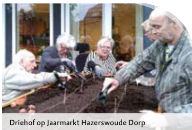
Driehof op Jaarmarkt Hazerswoude Dorp