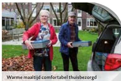
Warme maaltijd comfortabel thuisbezorgd