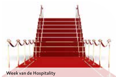
Week van de Hospitality