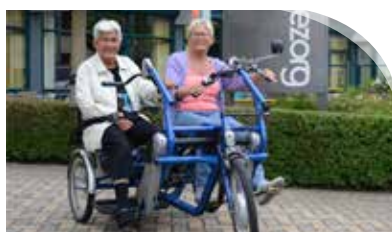
Gezellig samen op pad met de duofiets