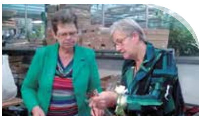
Dag van de Mantelzorg