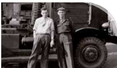
Oud-marinier liep Koningin Juliana tegen het lijf