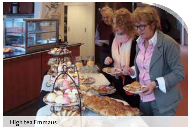
High tea Emmaus

“De mantelzorgers vonden het leuk dat we even stilstonden bij het werk dat zij verzetten.”