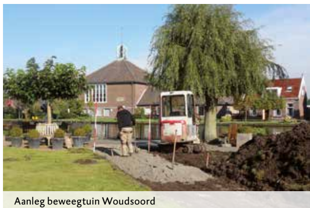
Aanleg beweegtuin Woudsoord

Zelf is Anja druk bezig met de ontwikkeling van een nieuwe beweegtraining voor ouderen, in samenwerking met gemeente Nieuwkoop en fysiotherapeuten. Deze training start naar verwachting in januari 2016 in locatie Nieuwkoop.