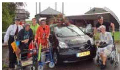
Wijdezorg valt in de prijzen!