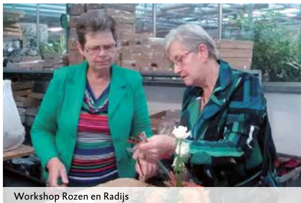
Workshop Rozen en Radijs