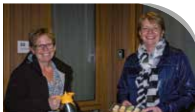
Koffieronde locatie Nieuwkoop