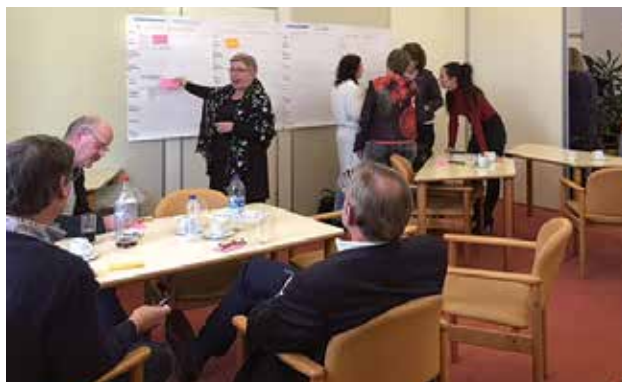
Inventarisatie van eisen en wensen op 9 december