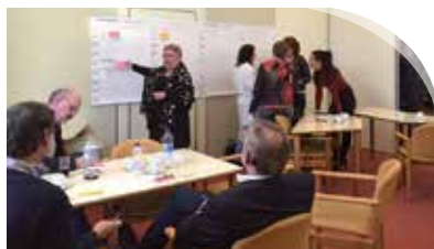
WIJdezorg werkt aan invoering ECD