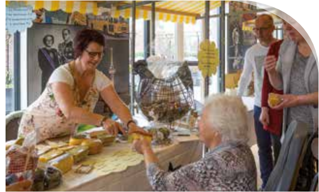
Lekker kaas proeven bij een van de kraampjes