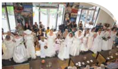
Bruidsmodeshow in Driehof