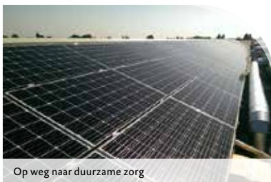
Op weg naar duurzame zorg