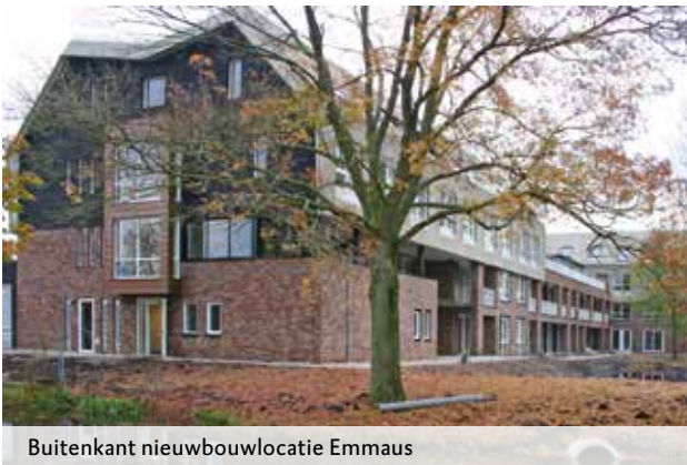
Buitenkant nieuwbouwlocatie Emmaus