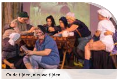
Oude tijden, nieuwe tijden