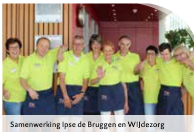
Samenwerking Ipse de Bruggen en WIJdezorg