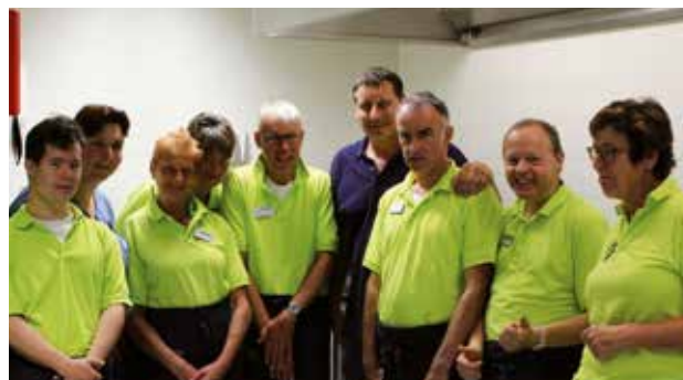
Cliënten van Ipse en medewerkers WIJdeZorg in de keuken van Kaleidoskoop

Wilt u meer informatie? Bel 088-209 17 25. Via dit telefoonnummer kunt u natuurlijk ook de Ipse de Bruggen appeltaart bestellen!