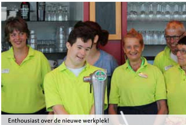
Enthousiast over de nieuwe werkplek!

dagbesteding van Ipse de Bruggen. Dankzij deze samenwerking kunnen bewoners en bezoekers nu op weekdays tussen 9.00 en 16.00 uur drankjes en gerechten van de kleine kaart bestellen.