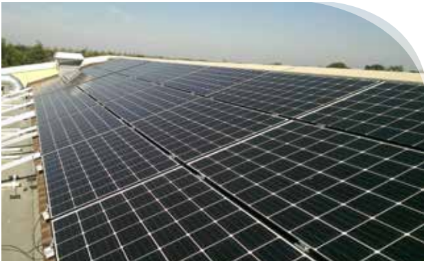
Zonnepanelen op het dak van Emmaus