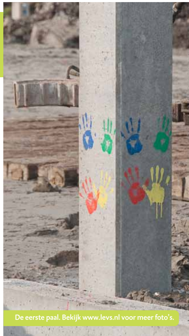
De eerste paal. Bekijk www.levs.nl voor meer foto's.