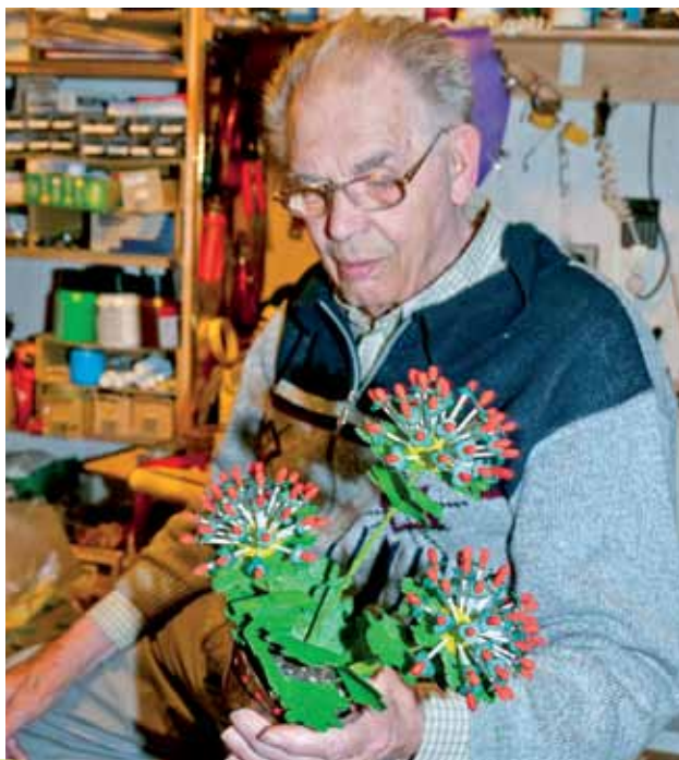
Meneer Oomen: "Ik zit hier maar wat aan te knoeien."

Sinds 2006 concentreert meneer Oomen zich naar eigen zeggen op het kleinere werk. "Ik ben mijn eigen baas en maak wat ik wil. Vroeger werkte ik ook wel voor mijn schoonzoon. Zijn bedrijf verzorgt feesten en ik maakte bijvoorbeeld decors. Tegenwoordig kan ik minder goed van huis, dus dat doe ik niet meer. Nu zit ik hier lekker wat voor mezelf te rommelen, veelal met weggooimateriaal. Bij de kringloop vond ik bijvoorbeeld drie pakken met piepschuim bakjes, die gebruik ik als basis voor de kunstplantjes die ik maak. Ik werk veel met piepschuim en hardschuim, dat bewerk ik met een speciaal snijapparaatje met een gloeidraad."