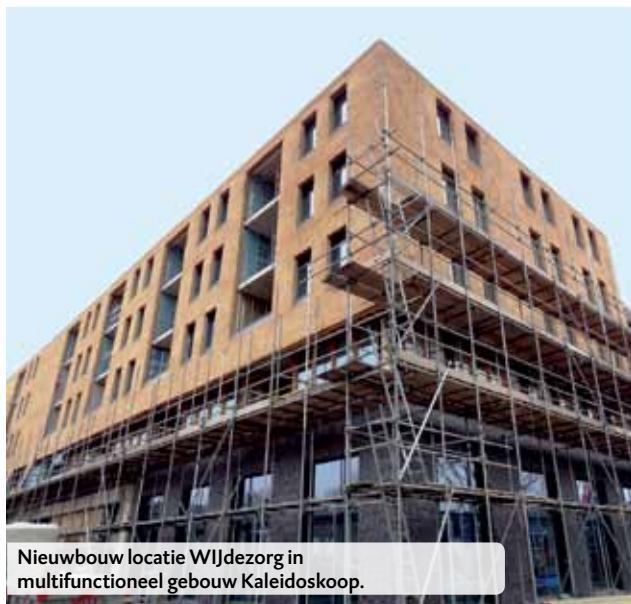
Nieuwbouw locatie WIJdeZorg in multifunctioneel gebouw Kaleidoskoop.