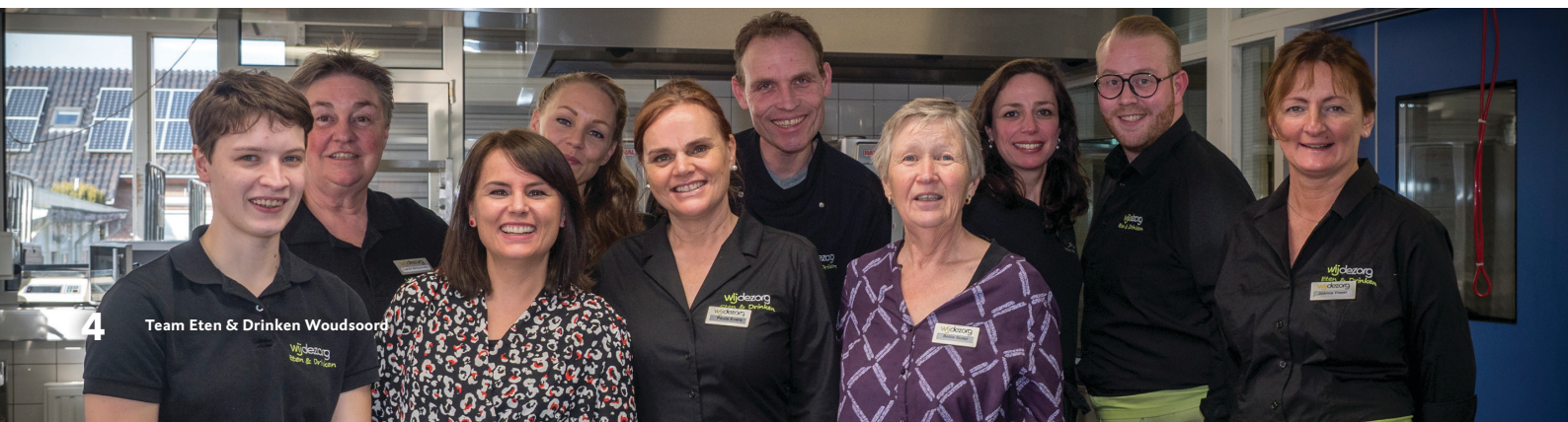
4 Team Eten & Drinken Woudsoord