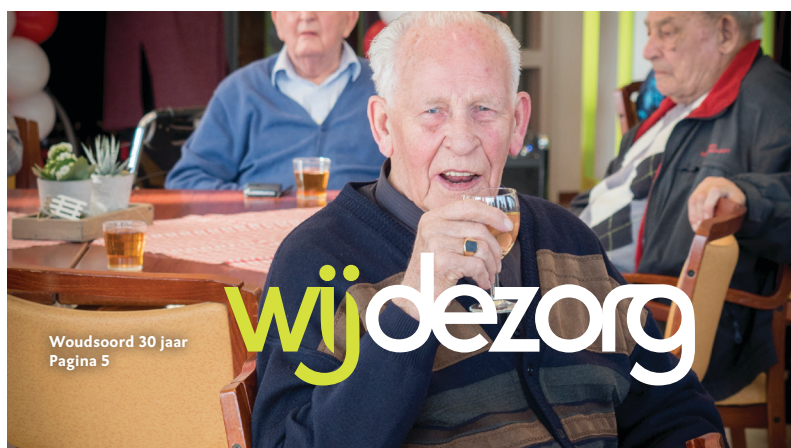
Woudsoord 30 jaar Pagina 5