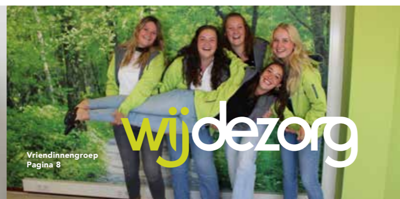
Vriendinnengroep Pagina 8